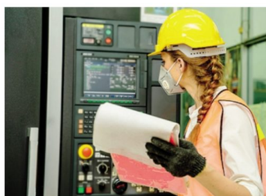
In alcune aziende potrebbero aprire spazi per vaccinare

«Il sindacato ha commentato in modo favorevole e anche a livello regionale qualche assessore lombardo (Morattie Guidesi, ndr) ha accolto positivamente la proposta e si è detto disponibile a renderla operativa. Certo - ha aggiunto Gagliardi - questa strada sarà più percorribile quando saranno disponibili i vaccini con le caratteristiche di AstraZeneca, più facilmente conserva-