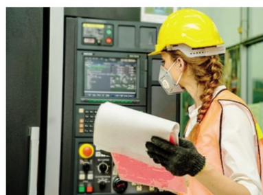
In alcune aziende potrebbero aprire spazi per vaccinare